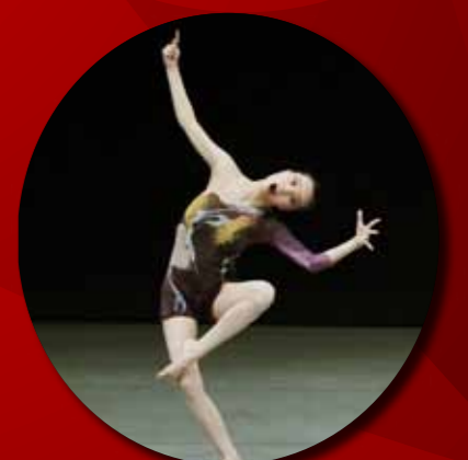
モダンダンス1部(成人の部)