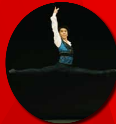
クラシックバレエ1部(成人の部)