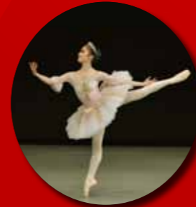
クラシックバレエジュニア部