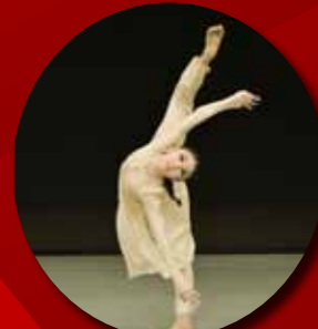
モダンダンス2部(児童の部)