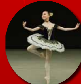
クラシックバレエ2部(児童の部)