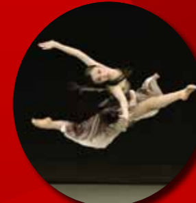
モダンダンスジュニア部