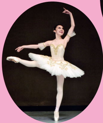
クラシックバレエ・ ジュニア部