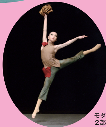
モダンダンス・ 2部 (児童の部)