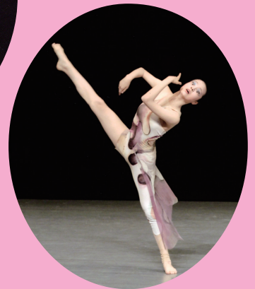
モダンダンス・ ジュニア部