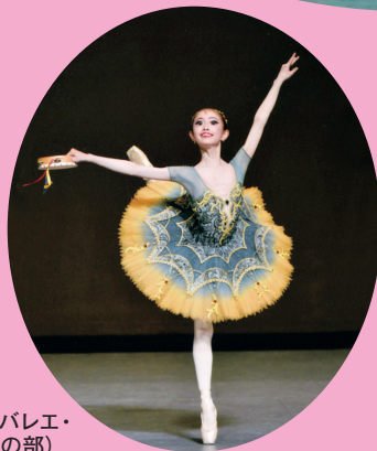
クラシックバレエ・ 2部 (児童の部)