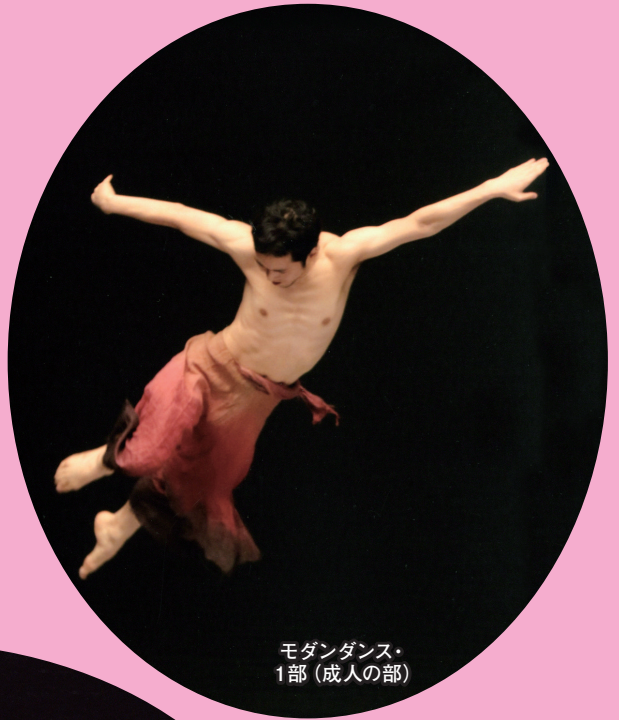
モダンダンス・ 1部 (成人の部)