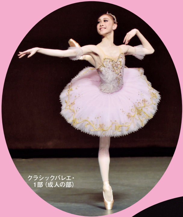
クラシックバレエ・ 1部 (成人の部)